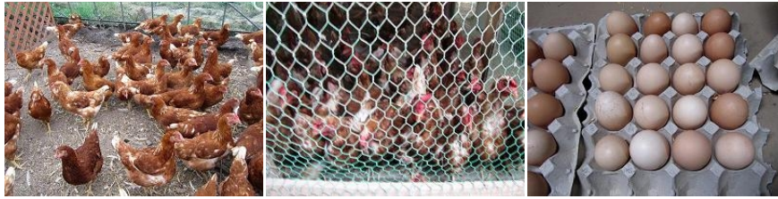
鶏の卵の色が変わり、鶏の羽が抜け始めた