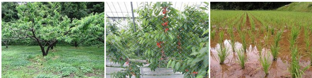
出荷停止となった物（モモ、サクランボ、お米、など）