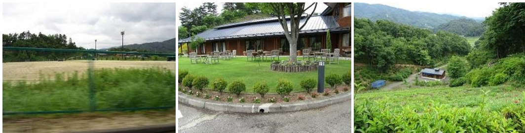
放射性物質・放射線量の高いところ、学校、公園、山、など