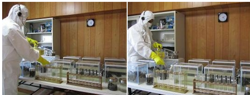
放射能汚染に対してサイオンEM技術試験・研究プロジェクト