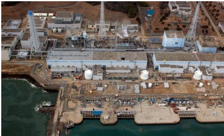
福島原子力発電所