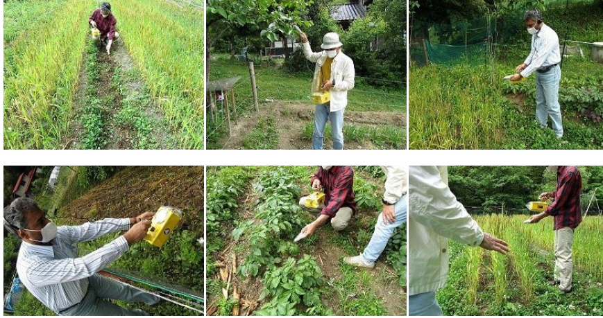
放射線量が高い土壌