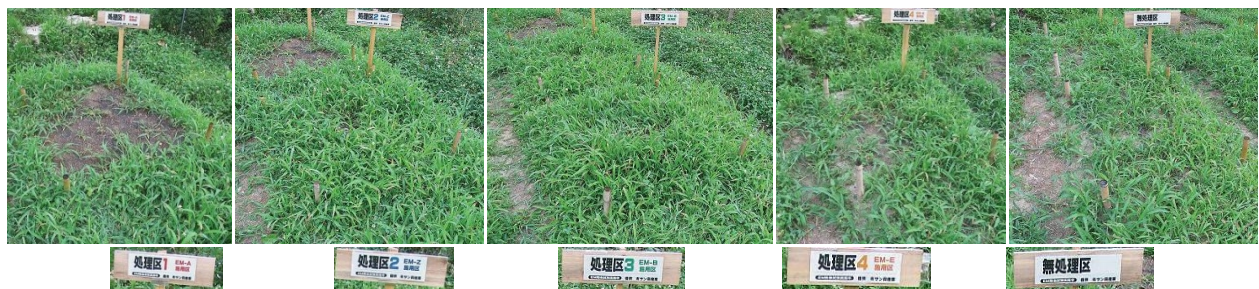
研究・試験結果は終了後公開する